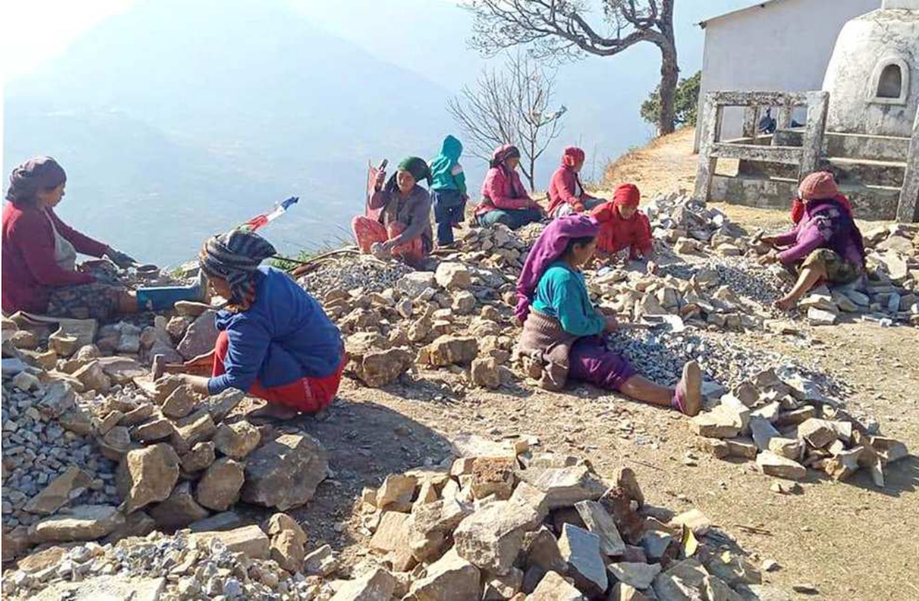
गिद्धी कुट्टे मजदुर : लमजुङ मर्स्याङ्दी गाउँपालिका-८ भुस्मेमा गिद्धी कुट्टे मजदुर महिलाहरू ।