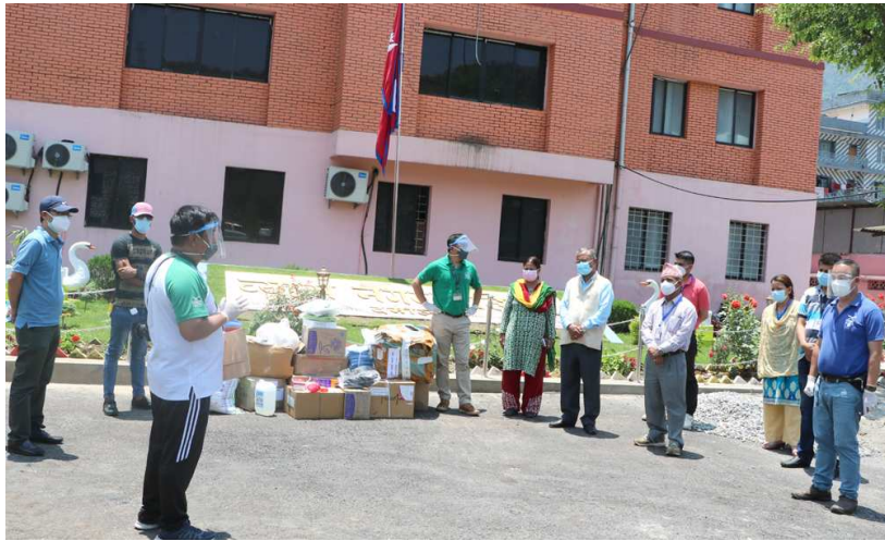
कोभिड-१९ संक्रमितको उपचार तथा व्यवस्थापनमा आवश्यक पर्ने स्वास्थ्य सामाग्री व्यास नगरपालिकालाई हस्तान्तरण गर्दै गोर्खा वेलफेयर ट्रस्ट नेपालका अधिकारीहरू ।