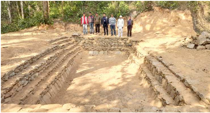
तनहुँमा वन्यजन्तुले किन देखिएको उहाँले बताउनुभयो ।

वन कार्यालय तनहुँले जंगलमा पोखरी निर्माण गर्न तथा जथाभावी जंगलका रुख ढालेर डोजरे विकास नगर्न जिल्लाका दश वटै पालिकालाई आग्रह गरेको छ ।