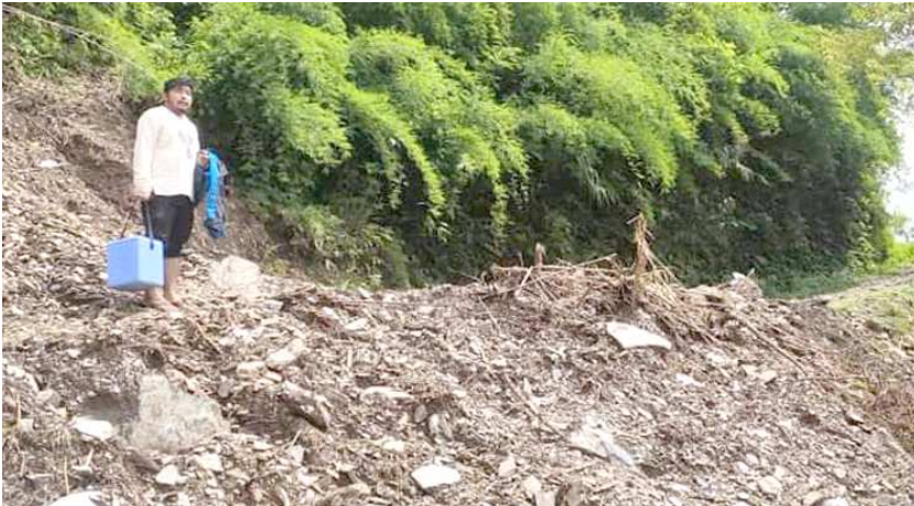
तनहुँको ग्रामीण क्षेत्रमा खोप लार्दै गरेका एक स्वास्थ्यकर्मी ।

आइपुग्न मलाई ११ घण्टा लाग्यो । पहिरो माथीमाथी कोल्डबक्स लिएर हिंड्न गाह्रो हुँदो रहेछ । 'गाउँका स्वास्थ्य चौकीमा फ्रिज छैन त्यसैले चैतदेखि यता तीन