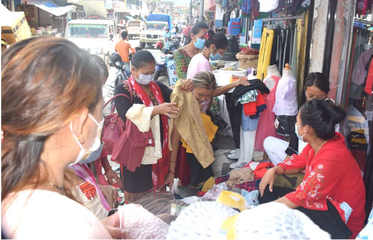
दर्शको लागि कपडा रोज्दै ग्राहक : लमजुङको बैसीशहर नगरपालिका-७ स्थित बैसीशहर बजारको सडक छेउमै राखिएको फुटपाथ पसलमा दर्शको लागि कपडा रोज्दै ग्राहक । कोरोनाले सुनसान बनेको पसल यतिबेला चहपल बढ्न थालेको छ ।