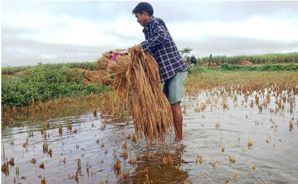
भिजेको धान सुरक्षित स्थानतर्फ लर्गिँदै : शुक्लाफाँटा नगरपालिका-१२ कालागौडीमा काटेर सुकाइएको धान भिजेपछि पानीबाट निकाल्दै किसान ।

पछिल्लो वर्षाले महोत्तरीसहित प्रदेश-२ का आठवटै जिल्लामा व्यापक क्षति गरेको हुँदा संघीय सरकारले तत्काल किसानलाई राहत दिने प्याकेज (योजना) दिनुपर्ने प्रदेश सरकारले माग गरेको छ । प्रदेशका मुख्यमन्त्री मोहम्मद लालबाबु राउत गद्दीले खेतीपातीमा भएको क्षतिबारे संघीय सरकारको ध्यानाकर्षण गराउँदै राहत प्याकेजको माग गर्नुभएको हो । रासस