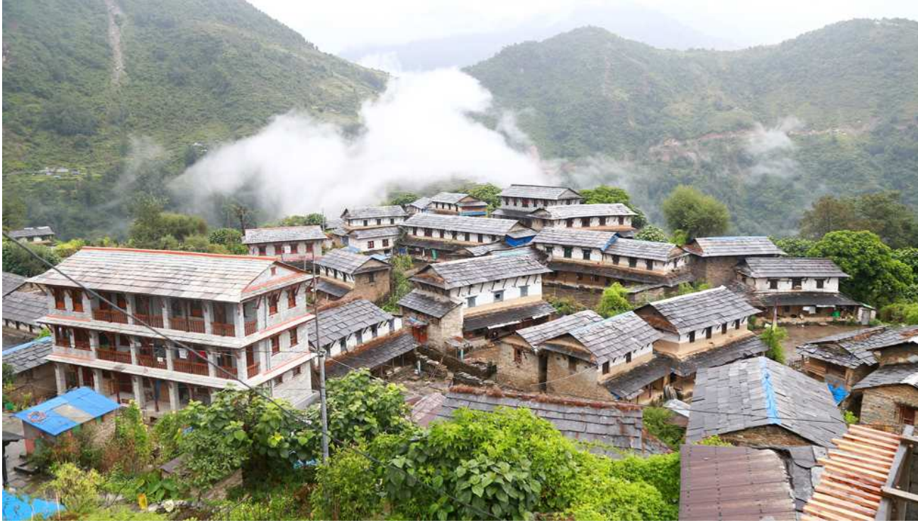
पर्यटकीय गाउँ गुरुङ बस्ती : कास्कीको घान्द्रुक गाउँपालिकामा अवस्थित गुरुङ बस्ती । स्वदेशी तथा विदेशी पर्यटक यहाँ घरवासका लागि र माछापुच्छे हेर्न आउने गर्छन् ।