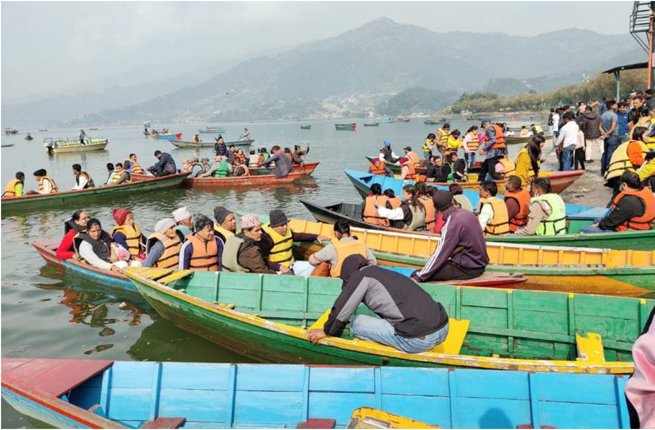
फेवातालको डुङ्गामा पर्यटक : पोखराको फेवातालमा डुङ्गा शयन तथा तालबाराही मन्दिर दर्शनका लागि आएका आन्तरिक पर्यटकको भिड।