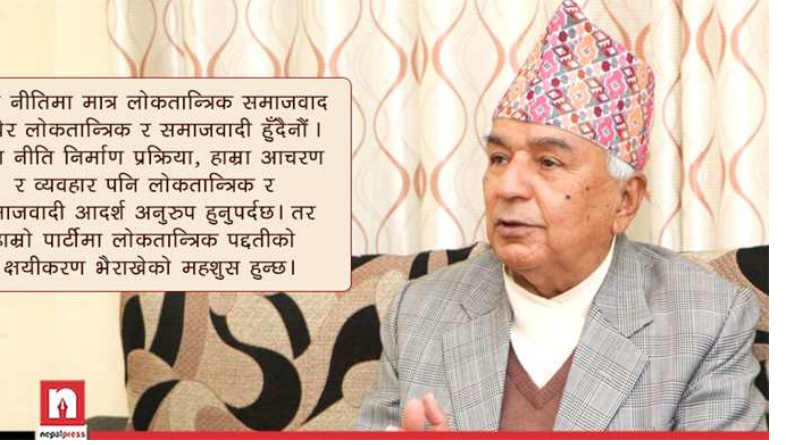
हासा नीतिमा मात्र लोकतान्त्रिक समाजवाद लेखेर लोकतान्त्रिक र समाजवादी हुँदैनौं । हासा नीति निर्माण प्रक्रिया, हासा आचरण र व्यवहार पनि लोकतान्त्रिक र समाजवादी आदर्श अनुरूप हुनुपर्दछ । तर हासा पार्टीमा लोकतान्त्रिक पद्धतिको क्षयीकरण भैराखेको महशुस हुन्छ ।

आज कांग्रेसलाई आफ्ना नेताहरूका आचरण र व्यवहारमाथि निगरानी राखेर प्रश्न उठाउन सक्ने सक्षम र निडर कार्यकर्ताको आवश्यकता छ । नेताको भक्तिमा लिप्त नभइकन, मुलाहियामा नलागिकन निर्णय दिने र प्रश्न उठाउने आँट कार्यकर्तामा हुनु