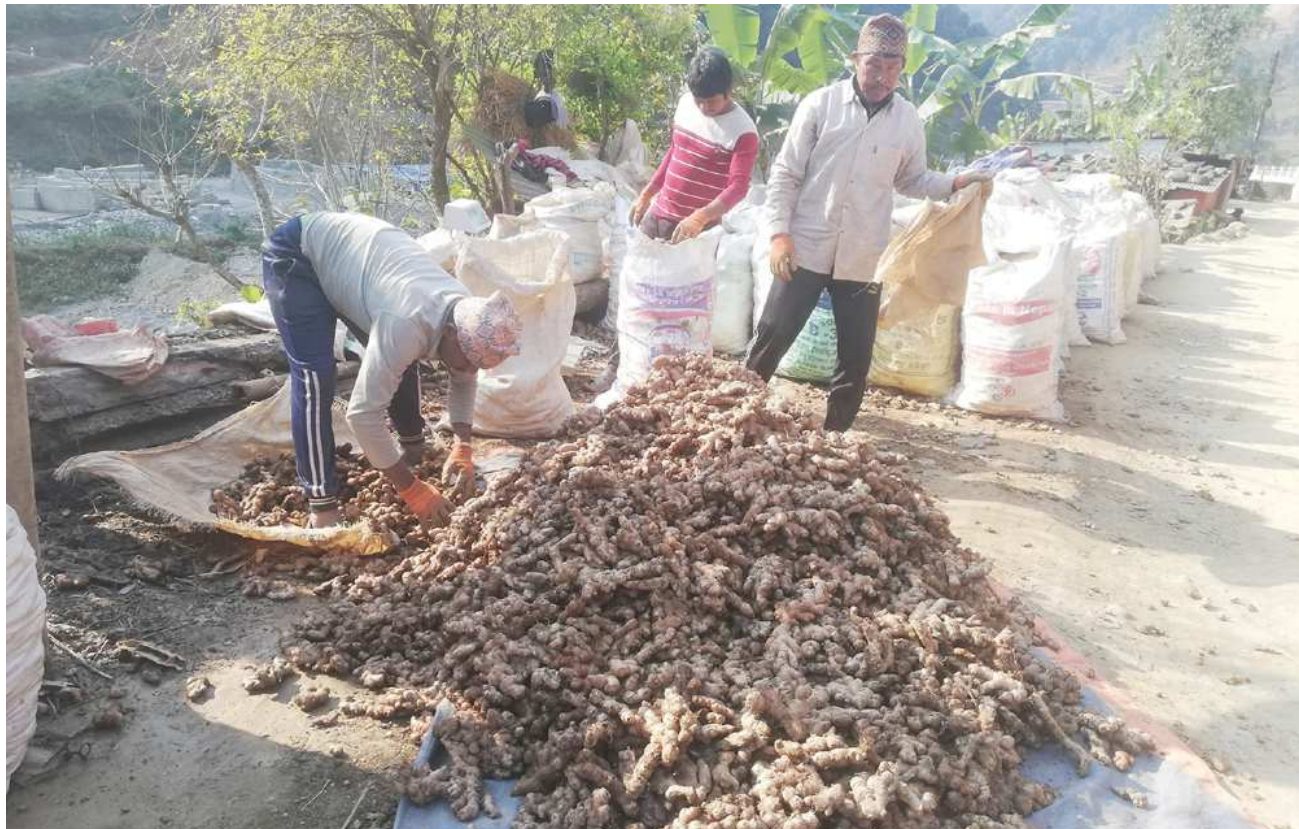
अदुवा भण्डारण : तनहुँको भिमाद नगरपालिका-६ लहरेनीमा ग्रामीण भेगबाट अदुवा खरिद गरी बिक्रीका लागि भण्डारण गर्दै स्थानीय व्यापारी। यहाँको अदुवा वीरगञ्ज, नवलपुरदेखि भारतसम्म बिक्रीवितरण हुने गरेको छ ।

Dumre Bazar, Tanahun. Ph. 065-580170, 580287