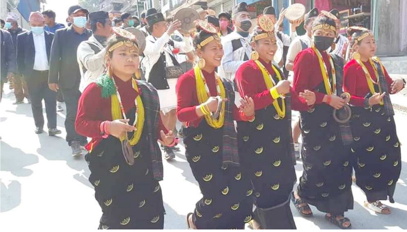
स्वागत नृत्य : अखिल नेपाल फुटबल संघ तनहुँ र युवा क्लब भिमादले भिमाद रंगशालामा आयोजना गरेको तनहुँ जिल्ला लिग फुटबल प्रतियोगिता-२०७८ शुभारम्भ समारोहमा सहभागी खेलडी तथा अतिथिहरूलाई कौरा नृत्य प्रस्तुत गरी स्वागत गर्दै स्थानीय युवायुवती ।