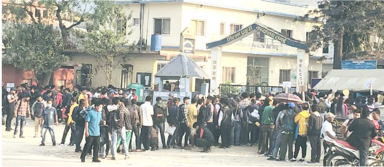
म्यादी प्रहरीमा आवेदन दिनेको भीड : वैशाख ३० गते हुने स्थानीय तह निर्वाचनका लागि जिल्ला प्रहरी कार्यालय तनहुँमा माग गरेको म्यादी प्रहरीमा आवेदन दिन लामबद्ध युवाहरु ।