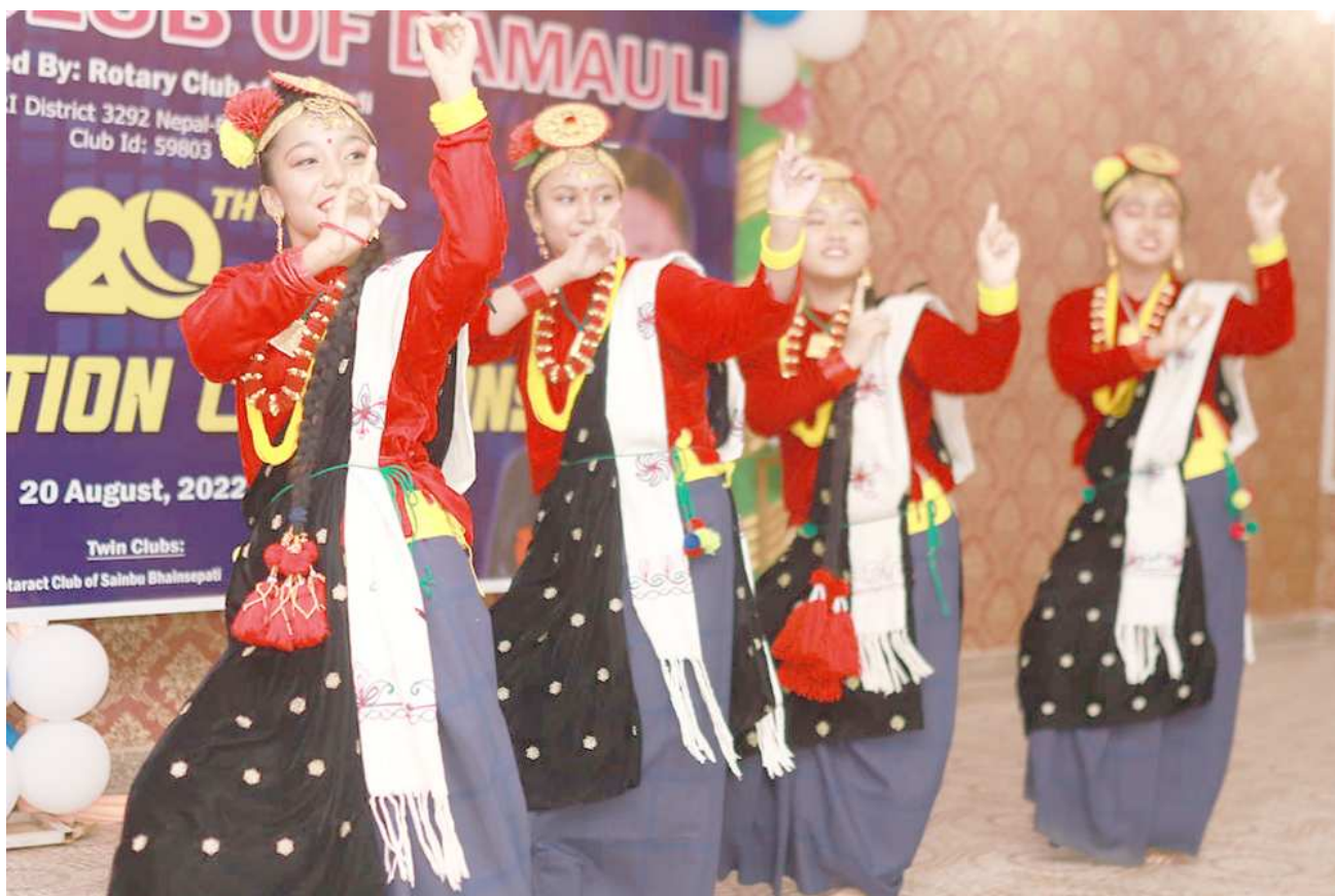
तनहुँका युवतीको कौरा नृत्य : रोट-क्लब अफ दमौलीको २०औं पदस्थापन कार्यक्रममा कौरा नृत्य प्रस्तुत गर्दै युवतीहरू । कौरा गीत र नृत्य नयाँपुस्तालाई आकर्षित गर्ने गरेको छ ।

सुर्य पेन्ट, ढोकापल्ला, भ्याल/ढोका चौकोस, प्लाई, फरमाइका, सिमेन्ट बोर्ड, जिप्सन, कानिस (पेरिस बुट्टा), वालपेपर फिटिङका सामान तथा किचन डेकोरेसनका सम्पूर्ण सामानहरू सुपथ मूल्यमा चाहिएमा हामीलाई सम्भन्नुहोस ।