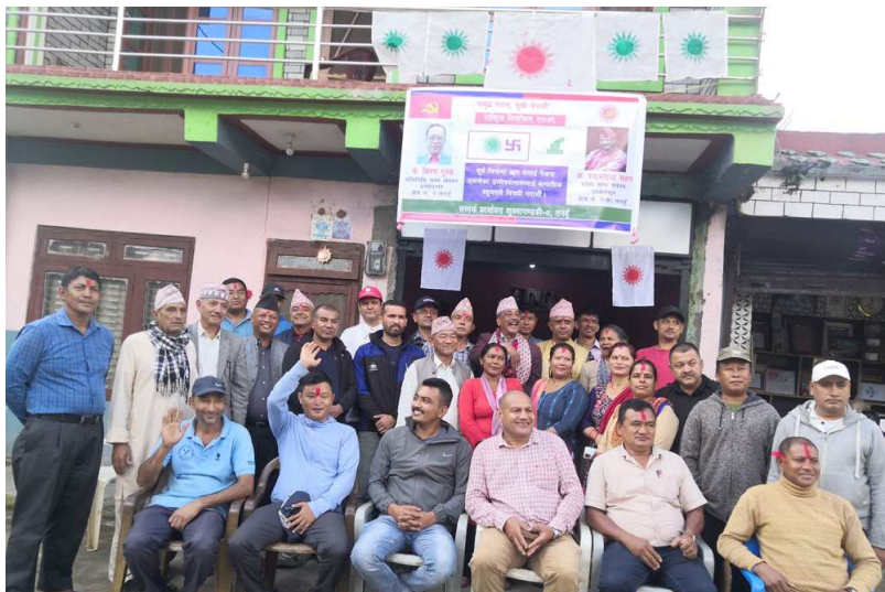
तनहुँ क्षेत्र नं. २(१) को शुक्लागण्डकी-८ मा नेकपा (एमाले) नगर कमिटीले निर्वाचन सम्पर्क कार्यालय स्थापना पश्चात समुहिक तस्वीरमा नेता कार्यकर्ताहरू ।

मिलेको बताउँदै यस क्षेत्रका जनताले अत्याधिक महतले विजयी गराउने विश्वास व्यक्त गरे । उनले जनताको जनजिविका, भ्रष्टचार विरुद्ध आवाज उठाउने र निति निर्माणका लागि आफ्नो मुख्य भूमिका रहने प्रष्ट पारे ।