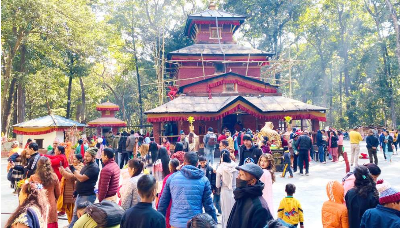
कालिका भगवती मन्दिर : माघको पहिलो शनिबार बागलुङको कालिका भगवती मन्दिरमा दर्शन गर्न आएका भक्तजनको घुइँचो ।