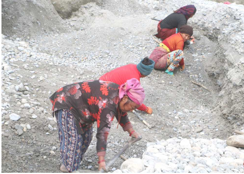
तनहुँको शुक्लागण्डकी नगरपालिकाको दुलेगौडा स्थित सेती नदी किनारको शौखर घाटमा बालुवा निकाल्दै गरेका खानी मजदुरहरू ।

गृह मन्त्रालयले मापदण्ड विपरितका क्रसर उद्योग बन्द गराउन सबै जिल्ला प्रशासन कार्यालयलाई परिपत्र गरेसँगै अहिले तनहुँमा सञ्चालनमा रहेका २० वटा क्रसर उद्योग बन्द गरिएको छ । सरकारले अर्को निर्णय नगरेसम्म क्रसर उद्योग सञ्चालनमा आउने अवस्था छैन । कानून विपरीत ढुङ्गा, गिट्टी तथा बालुवा उत्खनन तथा दोहन कार्यलाई नियमन गर्न, वातावरण संरक्षण ऐनको पालना र यस सम्बन्धमा अदालतबाट भएको आदेश कार्यान्वयन गराउन स्थानीय प्रशासनले क्रसर उद्योग बन्द गरेपछि यससंग जोडिएका खानी मजदुरको दैनिकी भने असहज बन्न पुगेको छ ।