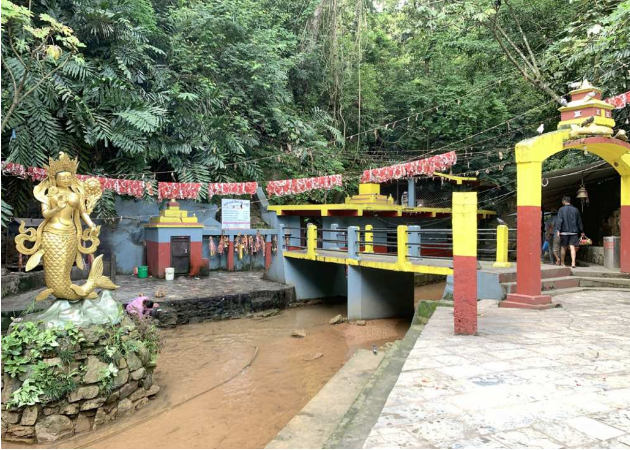
छाब्दीवाराही मन्दिर : तनहुँको व्यास नगरपालिका-१४ मा अवस्थित प्रसिद्ध छाब्दीवाराही मन्दिर । मनले चिताएको पूरा हुने धार्मिक विश्वासकासाथ यहाँ विभिन्न जिल्लाबाट भक्तजन आउने गर्छन् ।