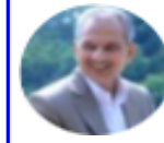
Baburam Bhattarai x.com/brb1954

यति युगान्तकारी र वलिदानीपूर्ण आन्दोलन पछि अब जेन-जी लगायतका युवा पुस्ताले निर्वाचन मार्फत देशको नेतृत्व लिएर अघि बढ्ने मार्ग अनुसरण गर्नु उपयुक्त हुन्छ। त्यसनिम्ति मतदाता सूचीमा वेलैमा नाम दर्ता गर्ने काम पहिलो कदम हो। तसर्थ देश-विदेशमा रहनु भएका सबैले नियम अनुसार समयमै नाम दर्ता गर्न सबैलाई हार्दिक आग्रह गर्दछु। नत्र नेपाली राजनीतिमा उही पुरानै चक्र दोहोरिने र युवाहरूले पछुताउनुपर्ने स्थिति आउन सक्छ। यसको साथै सरकारले र निर्वाचन आयोगले उपयुक्त र सम्भव बाटो अबलम्वन गरेर नागरिकता प्राप्त गर्ने र भोट हाल्ने उमेर एउटै अर्थात् १६ वर्ष गर्नु राम्रो र सहज हुनेछ। त्यस अतिरिक्त निर्वाचनमा उम्मेदवार बन्ने उमेर हद २५ वर्षबाट घटाएर १८ वर्ष वा कमसेकम २१ वर्ष गर्नु आवश्यक छ। नत्र पछिल्लो आन्दोलनका अगुवा जेन-जी युवाहरूलाई आसन्न निर्वाचन 'जसको विहा उसैलाई नजिक नल्या' भन्ने लोकोक्ति जस्तो हुनेछ।