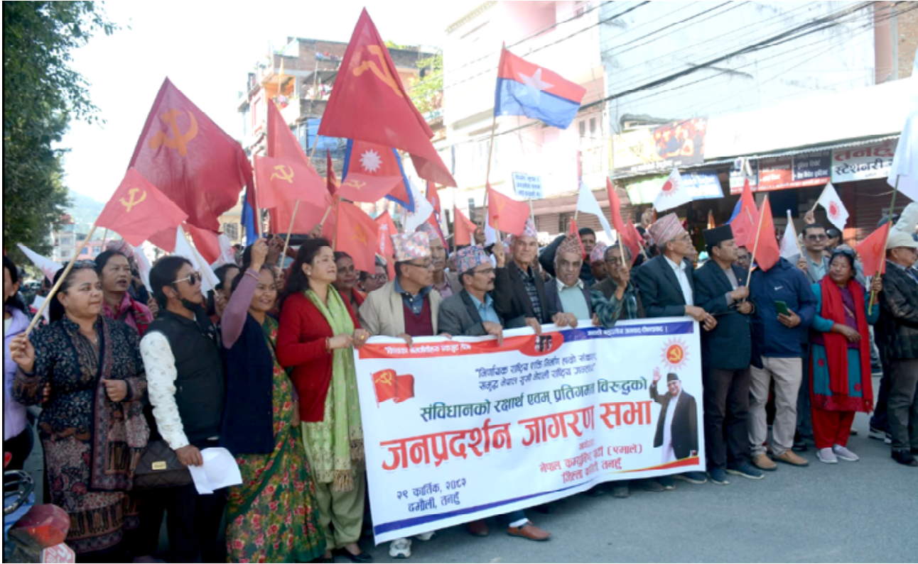
जनसभाका क्रममा पदयात्रा : नेपाल कम्युनिष्ट पार्टी (एमाले) तनहुँ जिल्ला कमिटीले शनिबार दमौलीमा आयोजना गरेको जन प्रदर्शन जनसभाका क्रममा निकालिएको पदयात्राका सहभागीहरू ।