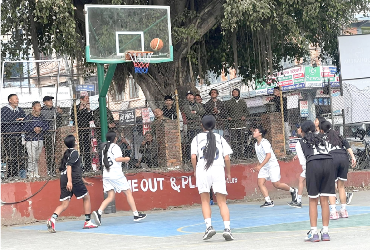
अन्तर विद्यालय बास्केटबल: हैरान्स क्लब दमौलीले व्यास नगरपालिका-३ मा सञ्चालन गरेको अन्तर विद्यालय स्तरीय बास्केटबल प्रतियोगिताको उपाधिका लागि प्रतिस्पर्धा गर्दै सत्यवती माध्यमिक विद्यालय र मर्स्याङ्दी माध्यमिक विद्यालयका छात्राहरू। प्रतियोगितामा सत्यवती माविले मर्स्याङ्दी माध्यमिक विद्यालयलाई ४-० अंकले पराजित गर्दै उपाधि हात पारेको छ।