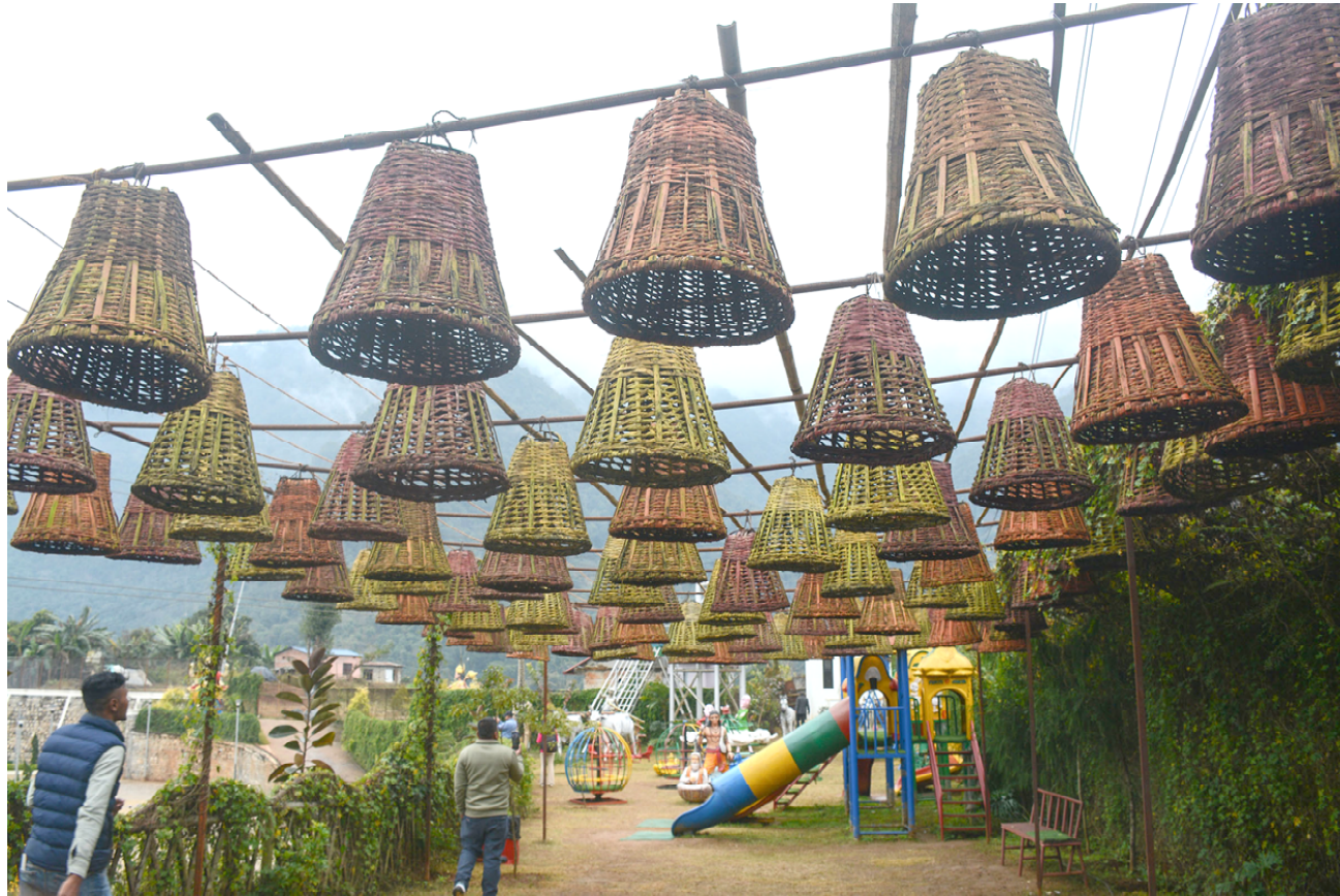
डोको पार्क : तनहुँको बन्दीपुर गाउँपालिका-४ टुलुङ्गास्थित बन्दीपुर केबलकारको स्टेशनमा डोकोको प्रयोग गरी बनाइएको पार्क । यसले यहाँ आउने पर्यटकलाई आकर्षित गर्ने गरेको छ ।