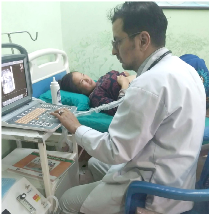
बन्दीपुर अस्पतालले बुधबार धरमपानी स्वास्थ्य चौकीमा सञ्चालन गरेको घुम्ती शिविरमा अल्ट्रासाउन्ड प्रविधिबाट गर्भवती महिला र शिशुको अवस्था परीक्षण गरिँदै।

समय, पैसा र यातायात सबै चुनौतीपूर्ण हुन्छन्। त्यसमाथि महिला र ज्येष्ठ नागरिकका लागि भन्नु कठिन। यस्ता