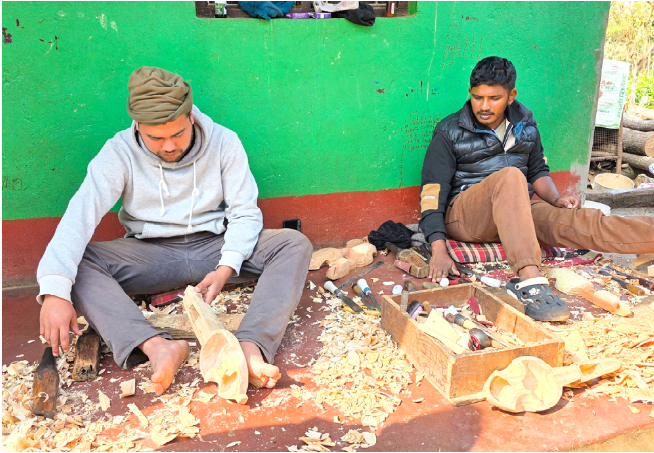
सारङ्गी बनाउँदै कालिगड : तनहुँको भानु नगरपालिका-१ स्थित नयाँबस्तीका स्थानीय कालिगड परम्परागत लोकबाजा सारङ्गी बनाउँदै । आकर्षक डिजाइनका सारङ्गी पाँच हजारदेखि १० हजार रूपैयाँसम्ममा बिक्री हुने गरेको छ ।

वर्ष ४४ अंक २७१ २०८२ फागुन ०७ गते विहीबार, नेपाल संवत् १९४६ February 19, 2026 पृष्ठ ४ मूल्य : रु. ५/-