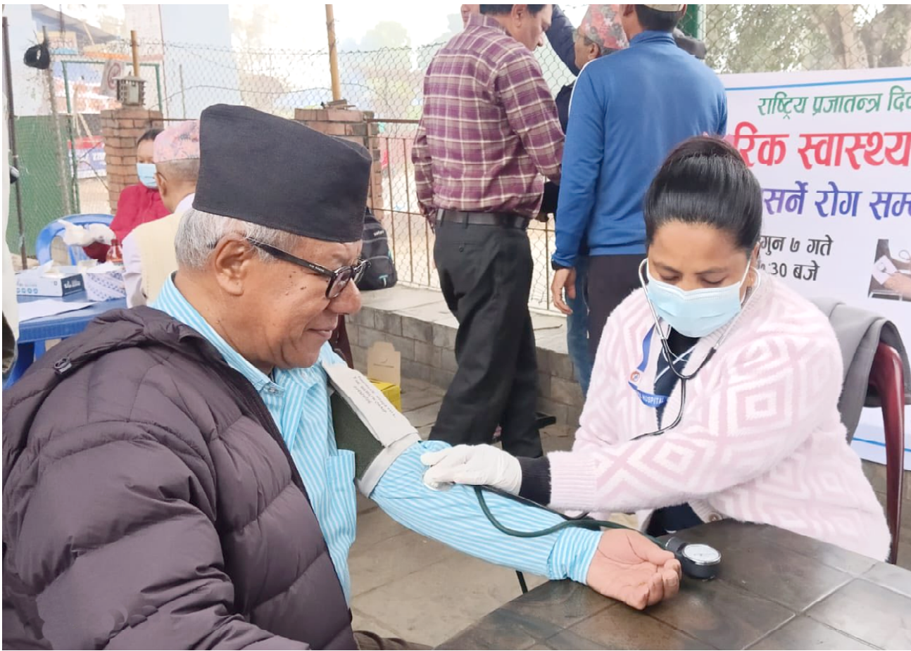
नसर्ने रोग सम्बन्धी स्त्रीनिड : राष्ट्रिय प्रजातन्त्र दिवस-२०८२ मुल समारोह समिति तनहुँले विहीबार बिहान दमौलीमा आयोजना गरेको नागरिक स्वास्थ्य परीक्षण कार्यक्रम (नसर्ने रोग सम्बन्धी स्त्रीनिड)मा सहभागिको स्वास्थ्य परीक्षण गरिदै । प्रदेश जनस्वास्थ्य कार्यालय, प्रदेश अस्पताल, प्रदेश आयुर्वेद चिकित्सालय र व्यास नगरपालिकालेको संयोजनमा स्वास्थ्य परीक्षण कार्यक्रम सञ्चालन गरिएको थियो ।