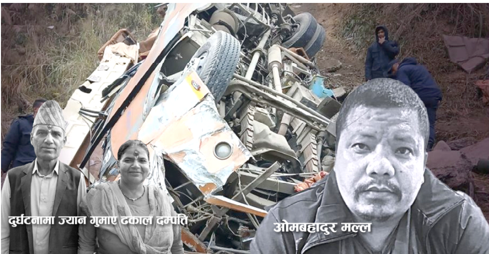
दुर्घटनामा ज्यान गुमाए ढकाल दम्पति

उनकी श्रीमतीको करङ र हात भौँचिएको छ । टाउकोमा