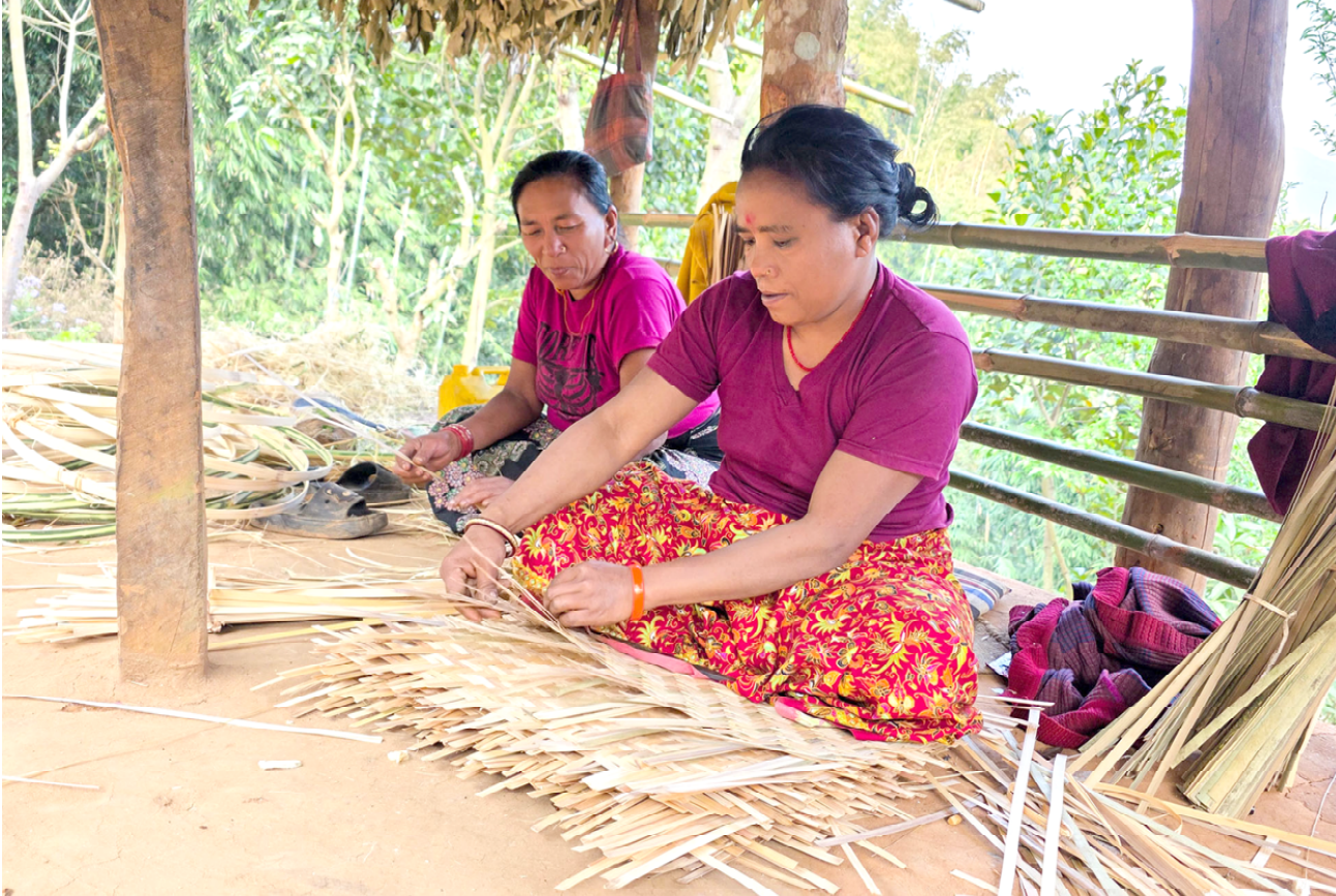
बाँसको चोयाबाट घरायसी सामग्री : तनहुँको बन्दीपुर गाउँपालिका-५ भुजेल गाउँमा बाँसको चोयाबाट घरायसी सामग्री नाङ्गलो बनाउँदै महिला । ग्रामीण भेगमा परम्परागत रूपमा प्रयोग गरिँदै आएको बाँसको चोयाबाट बुनिएका नाङ्गलो, डोको, डालो थुन्से, भकारीलगायतका सामग्रीहरू बेचेर यहाँका महिलाले आयआर्जन गर्दै आइरहेका छन् ।