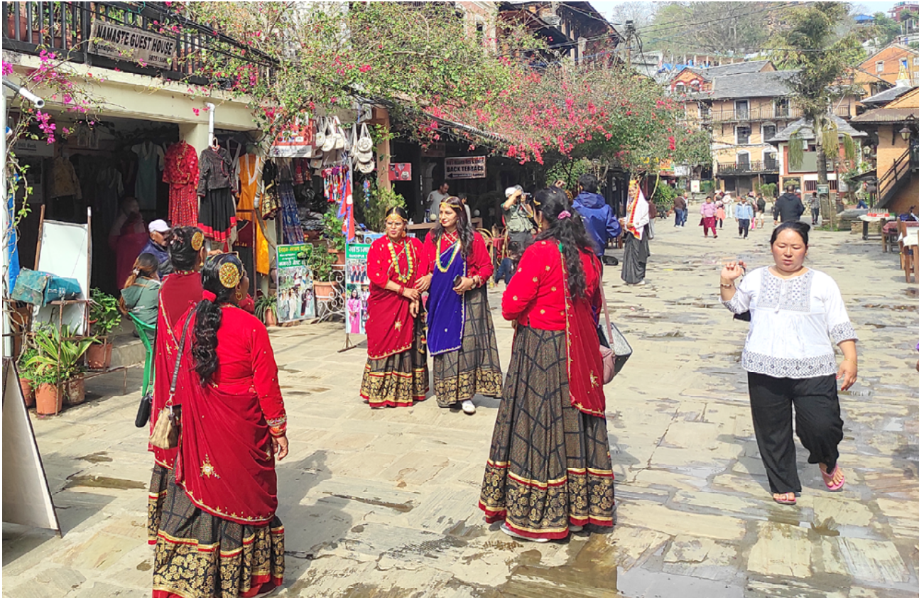
बन्दीपुरमा आन्तरिक पर्यटक : पहाडकी रानीको उपनामले परिचित तनहुँको पर्यटकीय नगरी बन्दीपुरमा आइतबार जातीय पहिचान भल्कने भेषभूषामा सजिएर तस्विर खिचाउँदै आन्तरिक पर्यटक । बिदाका दिन बन्दीपुरमा आन्तरिक पर्यटकको आगमन बढेको छ ।