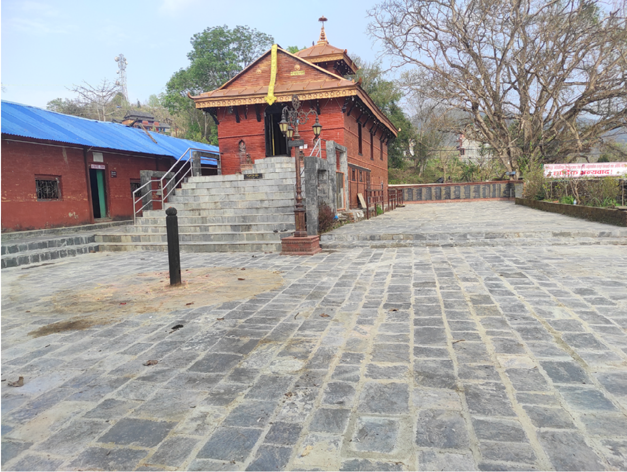
खड्गमाई मन्दिर : पर्यटकीय नगरी तनहुँको बन्दीपुरमा रहेको ऐतिहासिक महत्व र धार्मिक आस्था बोकेको खड्गमाई मन्दिर । गाउँपालिकाले मन्दिरको सौन्दर्यकरणका लागि प्राङ्गणमा ढुंगा बिच्छाएर आकर्षक बनाएको छ ।