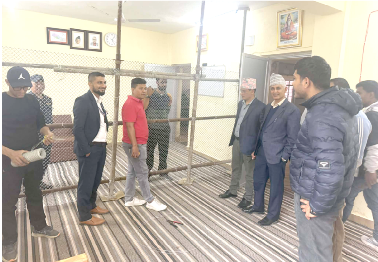
मतगणनास्थल : तनहुँ क्षेत्र नम्बर १ का लागि तयार गरिएको मतगणनास्थलको अनुगमन गरिदै । प्रतिनिधिसभा सदस्य निर्वाचन तनहुँ-१ को मतगणनास्थल मुख्य निर्वाचन अधिकृतको कार्यालयमा तयार गरिएको छ । तस्विर : भञ्ज्याङ