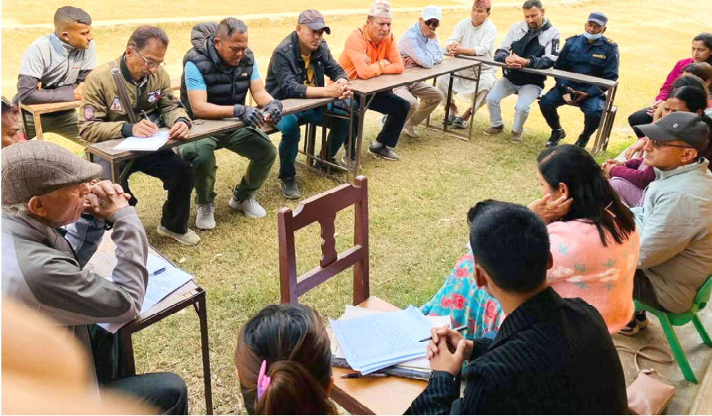
तनहुँ-१ अन्तर्गत बन्दीपुर गाउँपालिका-१ नाहालास्थित विष्णु माध्यमिक विद्यालयको मतदान केन्द्रमा मंगलबार आयोजित सर्वदलीय बैठक ।

कार्यालयले कारागार कार्यालय तनहुँ र कृषि विकास कार्यालय गरी जिल्लामा दुई अस्थायी मतदान केन्द्र तोकिएको जनाएको छ । निर्वाचनमा खटिने कर्मचारी तथा