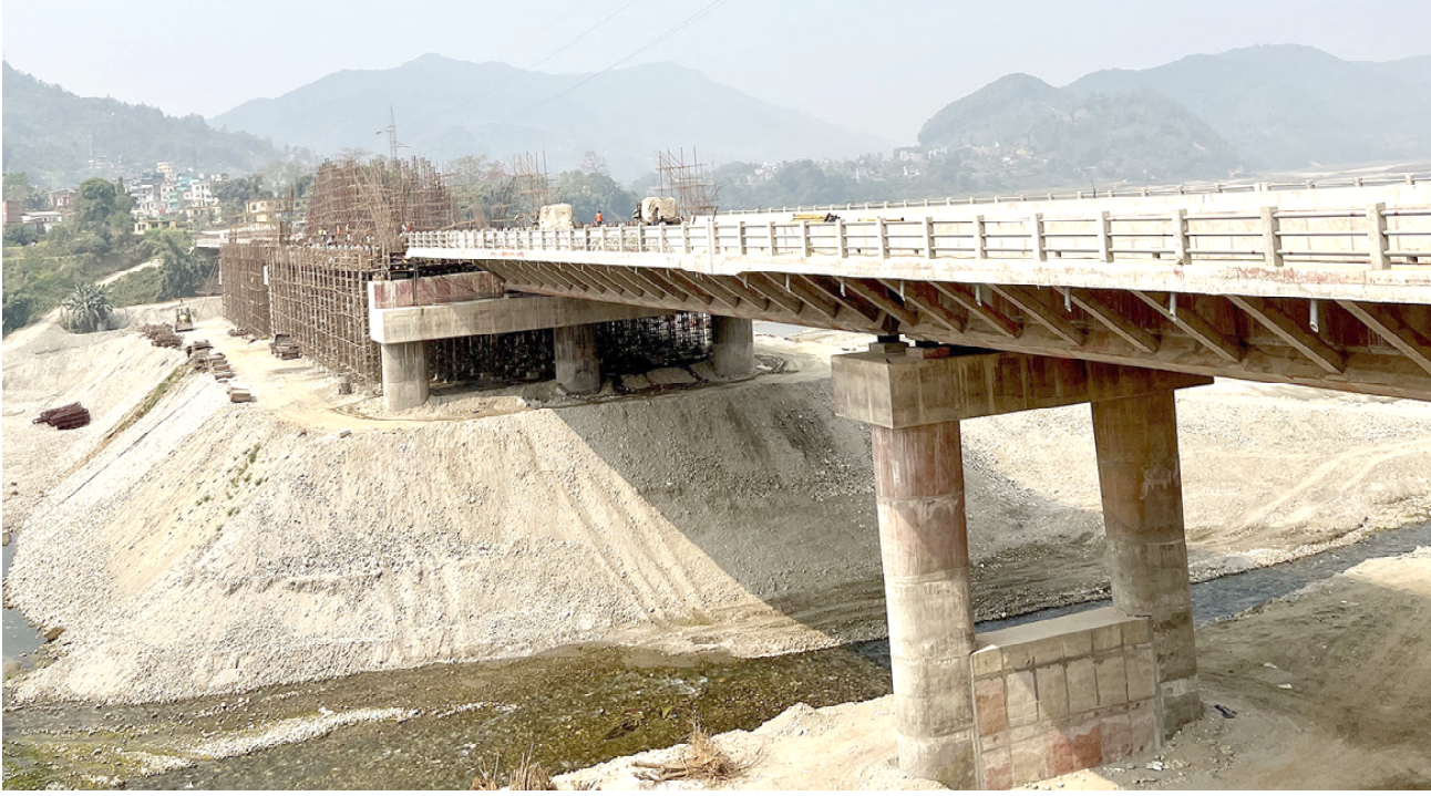
मादी नदीमा निर्माणाधीन पुल : तनहुँको व्यास नगरपालिका-४ र ५ जोड्ने मादी नदीमाथि निर्माणाधीन चार लेनको पुल । हाल पुलमा आर्क डिजाइनको काम भइरहेको छ ।