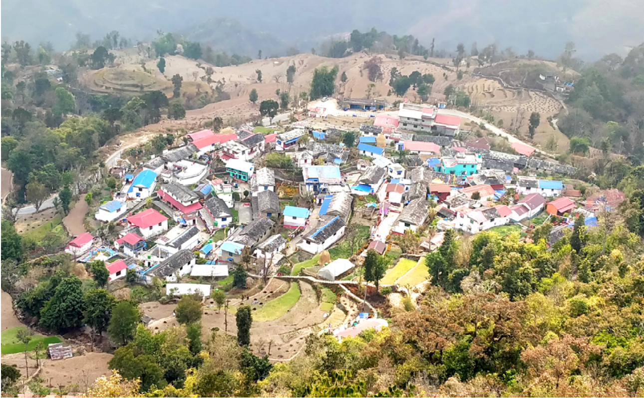
सिरुबारी गाउँ : स्याङ्जाको आँधीखोला गाउँपालिका-१ मा अवस्थित दक्षिण एसियाकै पहिलो सामुदायिक होमस्टे सिरुबारी गाउँ । यस गाउँ आन्तरिक तथा बाह्य पर्यटकको रोजाईमा पर्ने गरेको छ ।