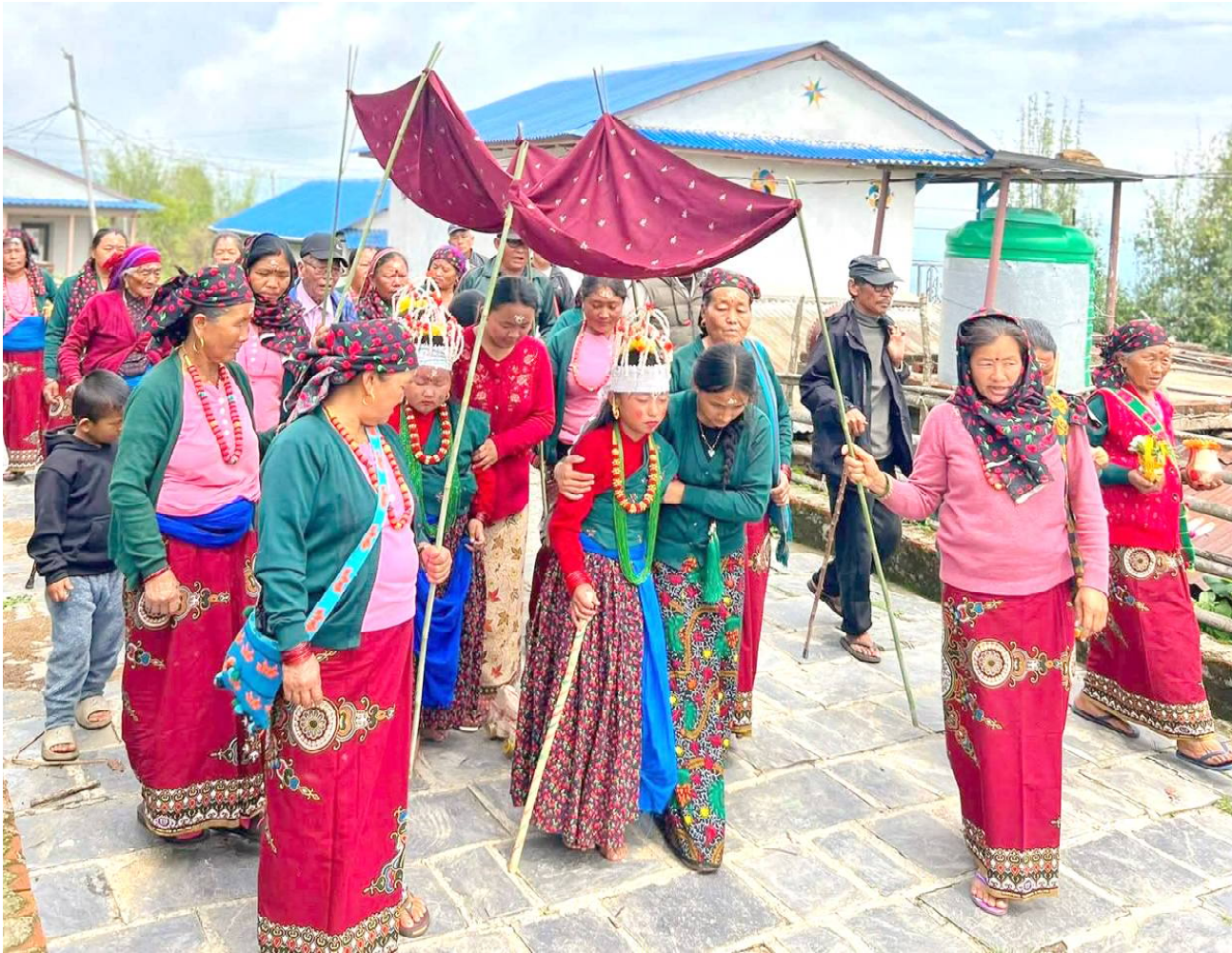
घाँटु नाच समापन : तनहुँको भानु नगरपालिका-१३ को बास्पानी गाउँमा परम्परागत रूपमा नचाइएको घाँटु नाच समापनका लागि देउराली, चण्डिथान तर्फ लैजाँदै । यी यस्ता रितिरिवाज, गाउँघरको मौलिक संस्कृति, एकता र परम्पराको अनुपम भल्को र महत्व बोकेको छ ।