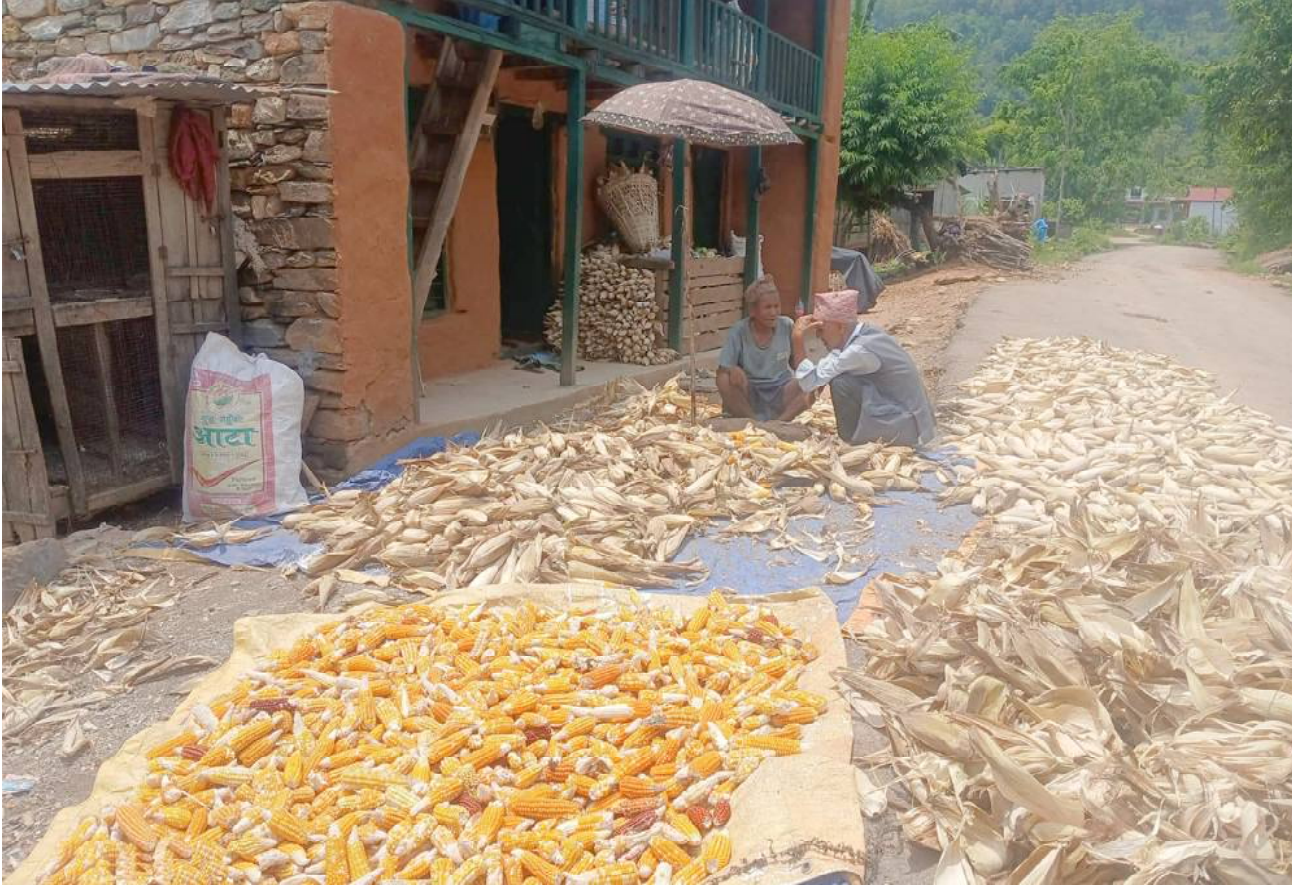
भण्डारणका लागि मकै सुकाउँदै : तनहुँको शुक्लागण्डकी नगरपालिका-१० लोकदिदारका किसान खेतमा रोपेको मकै पाकेपछि घरमा ल्याई भण्डारणका लागि सुकाउँदै । खेतको मकै खेती थन्काएसँगै किसानहरू असार धान खेतीको रोपाई गर्छन् ।