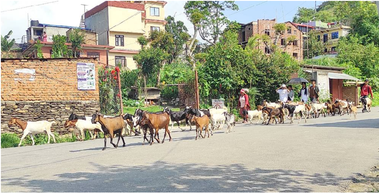
चरेर घर फर्कदै बाखा : तनहुँको बन्दीपुर गाउँपालिका-४ देम्चेका कृषकहरू बाखा चराएर घर तर्फ ल्याउँदै ।