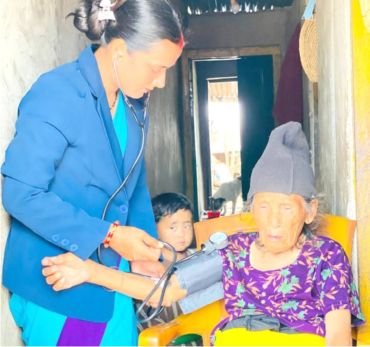
घरमै स्वास्थ्य सेवा : तनहुँको बन्दीपुर गाउँपालिका-६ घरमपानीकी एक ज्येष्ठ नागरिकलाई घरमै स्वास्थ्य परीक्षण सेवा दिँदै घरमपानी स्वास्थ्य केन्द्रकी स्वास्थ्यकर्मी । गाउँपालिकाले ज्येष्ठ नागरिक तथा असक्तहरुलाई घरघरमै प्राथमिक स्वास्थ्य परीक्षण, सरकारले निःशुल्क उपलब्ध गराउने र नियमित खानुपर्ने औषधी उपलब्ध गराउने लगायतका सेवा उपलब्ध गराउँदै आएको छ ।