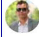
Narayan Amrit x.com/amritna

माओवादीको सरकारमा महारालाई, एमालेको सरकारमा बस्नेतलाई र बालेन्द्रको सरकारमा गुरुङ जस्तालाई कार्वाही होइन, पुरस्कृत मात्र गरिन्छ। किनकि उनीहरूको नाममा हुने बितण्डा स्वयं प्रमकै बितण्डाको कार्यान्वयन मात्र हो। यो मुलुक कहिल्यै पनि बिधि विधानमा चलेको होइन। भ्रष्ट कम्युनिष्टजस्तै 'भभ्भे समुह' पनि त्यसको अपवाद होइन।