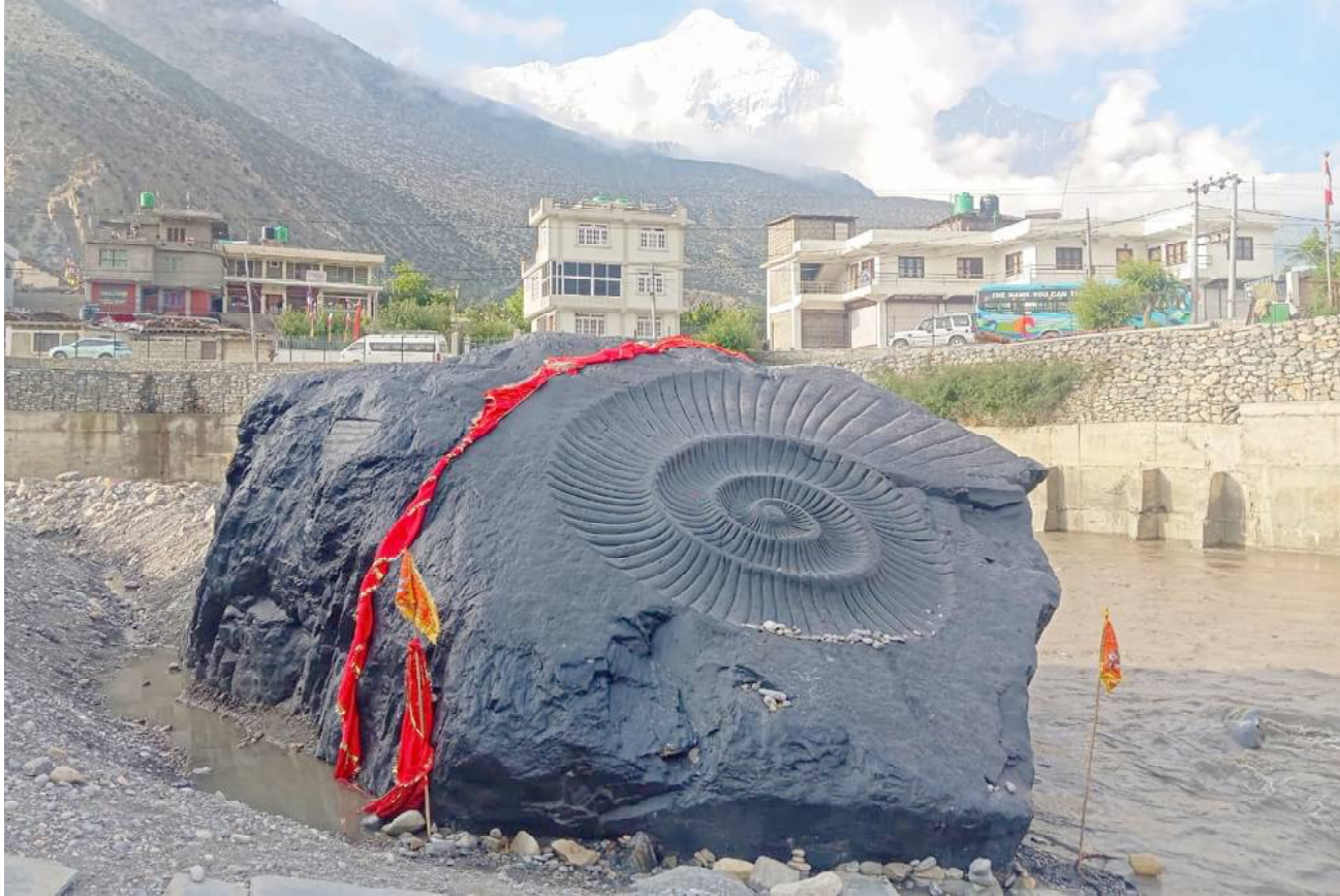
विराट शालिग्राम : मुस्ताङको सदरमुकाम जोमसोम बजार नजिकै कालिगण्डकी नदीको काखमा सुतेको विराट शालिग्राम । विश्वकै सबैभन्दा ठूलो शालिग्राम भएको दाबी गरिएको यो अदभूत शिलाले श्रद्धा, इतिहास र प्रकृतिको संगमलाई एकै स्वरमा गाइरहेको आभास हुन्छ ।