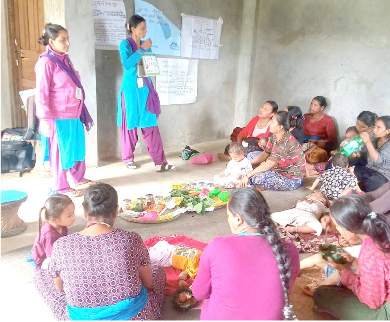
स्वास्थ्य सचेतना : तनहुँको ऋषिङ गाउँपालिका-४ स्थित भिरकोट स्वास्थ्य चौकीद्वारा सेवा क्षेत्रका बासिन्दामा स्तनपान। स्थानीय पोषणयुक्त तथा स्वास्थ्य खानाको उपभोग प्रवर्द्धनका लागि सचेतना अभिवृद्धि कार्यक्रम सञ्चालन गर्दै स्वास्थ्यकर्मी । तस्विर : भज्याङ