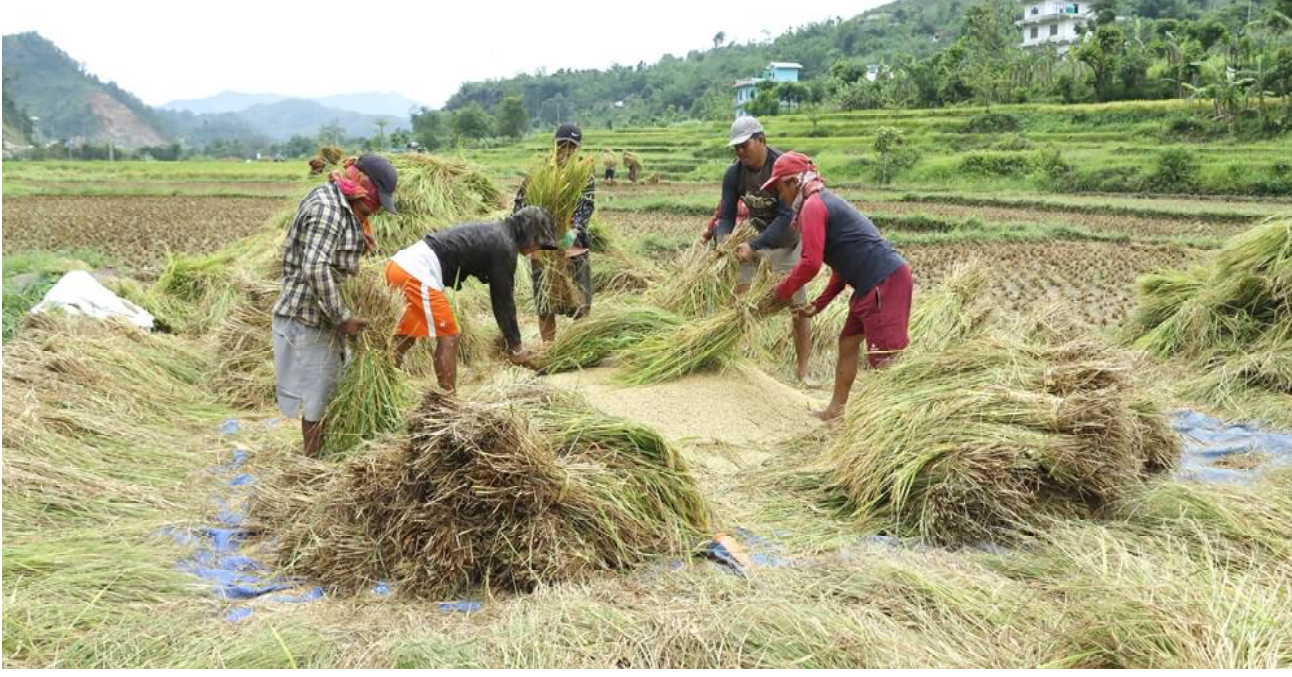
पाकेको धान खेती थन्काउने चटारो : तनहुँको व्यास नगरपालिका-११ घाँसीकुवामा चैते धान खेती पाकेपछि थन्काउनका लागि भाट्टाई गरेका कृषकहरू । चैते धान खेती थन्काएसँगै किसानहरूले असार धानखेती गर्दछन् ।